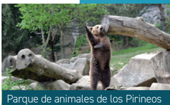
Parque de animales de los Pirineos