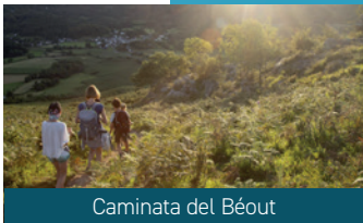
Caminata del Béout