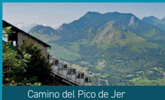
Camino del Píco de Jer