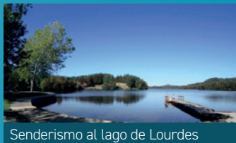
Senderismo al lago de Lourdes