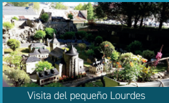
Visita del pequeño Lourdes