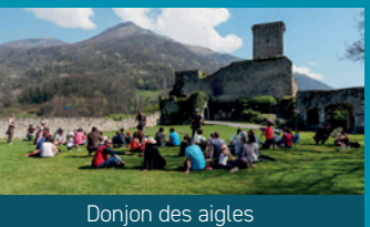
Donjon des aigles

Oficio de turismo: www.lourdes-infotourisme.com