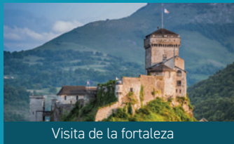
Visita de la fortaleza