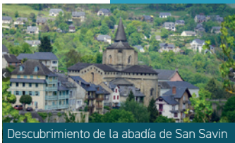
Descubrimiento de la abadía de San Savin